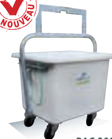
BAC 200 LITRES