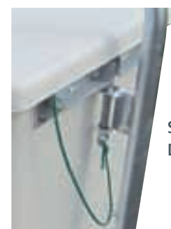
SYSTÈME DE VERROUILLAGE