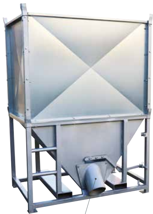
Option : c) goulotte